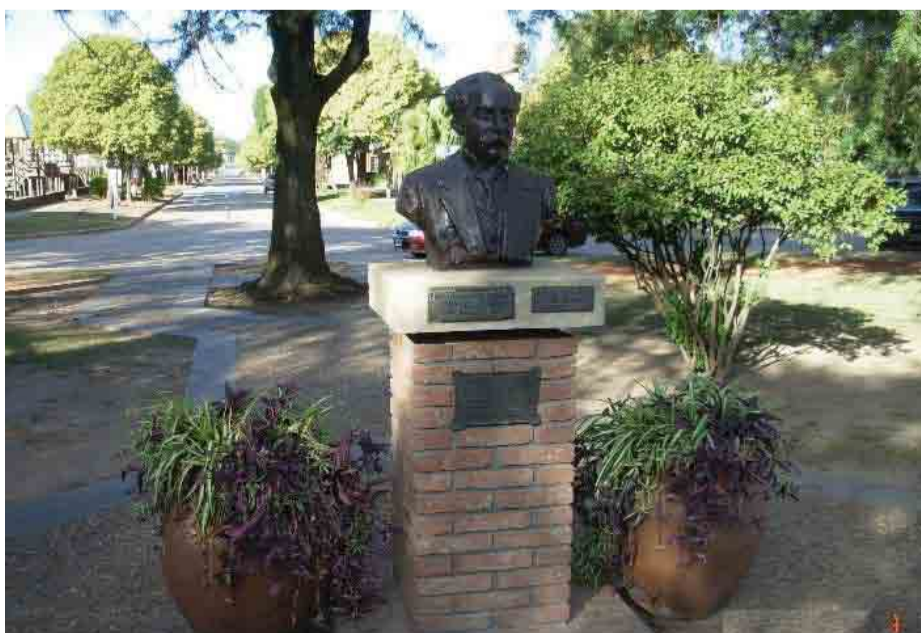
Busto Paulino Llambi Campbell