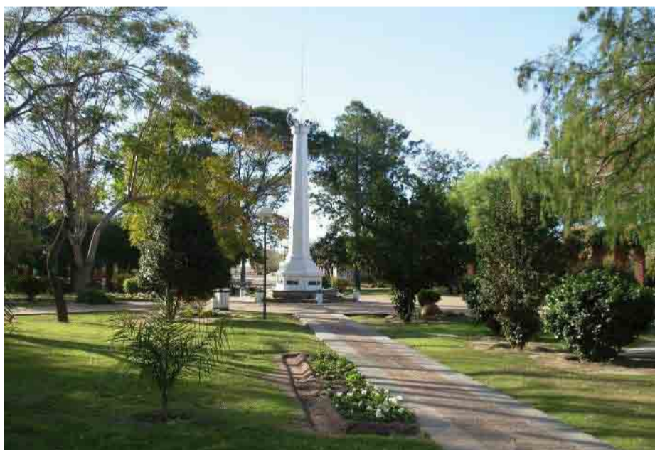
Plaza Llambi Campbell