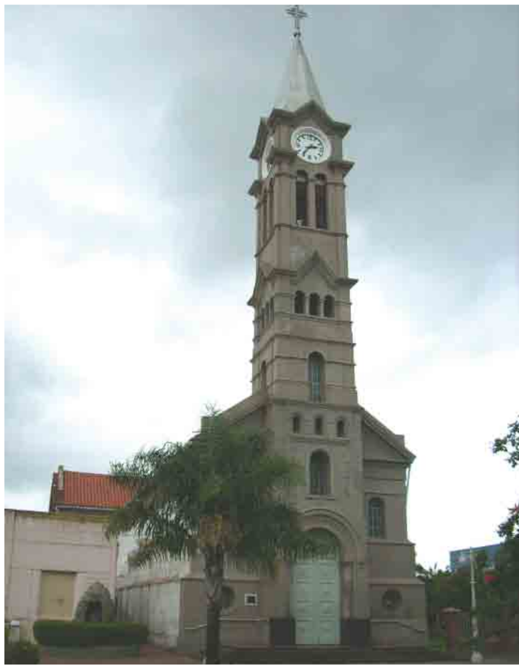
Iglesia de la Santísima Trinidad